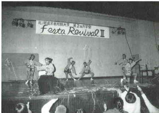
学園祭での後輩達のパフォーマンスより