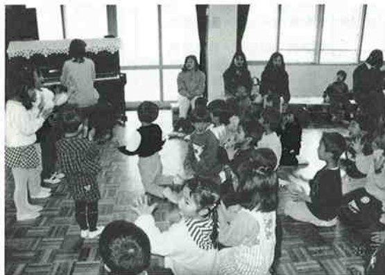
毎週土曜日実施されている子育て相談研究センターから